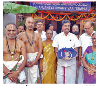
తిరుమల, మే 27 ప్రభాతవార్త ప్రతినిధి: టిడిపి ఆధ్వర్యంలోని తిరుపతి గోవిందరాజుస్వామి ఆలయంలో జరుగుతున్న వార్షిక బ్రహ్మోత్సవ వార్షిక బుద్ధవారం రాత్రి జరిగిన గరుడసేవ మహోత్సవం అపూర్వ ఆధ్యాత్మిక వైభవాన్ని